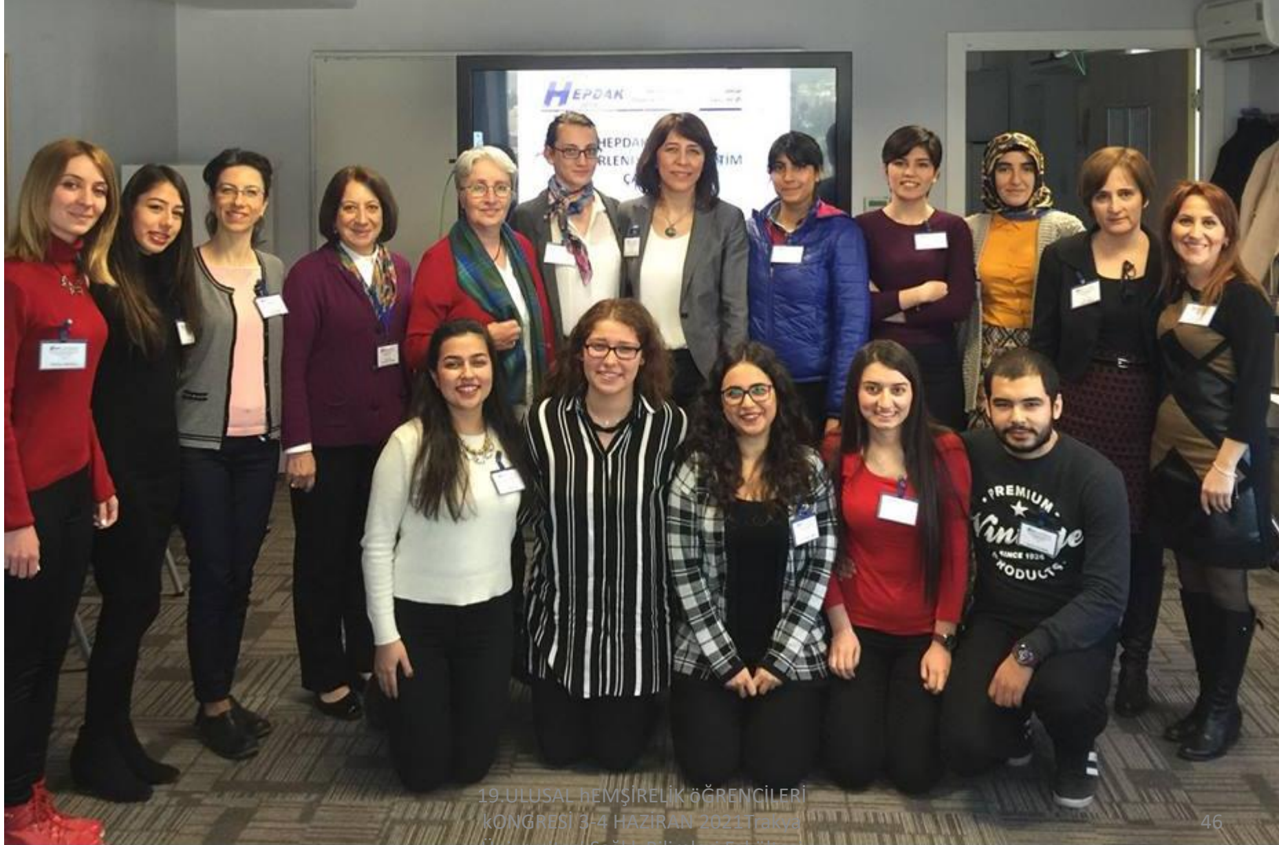
19. ULUSAL HEMŞİRELİK ÖĞRENCİLERİ KONGRESİ 3-4 HAZİRAN 2021 Trakya Üniversitesi Sağlık Bilimleri Fakültesi