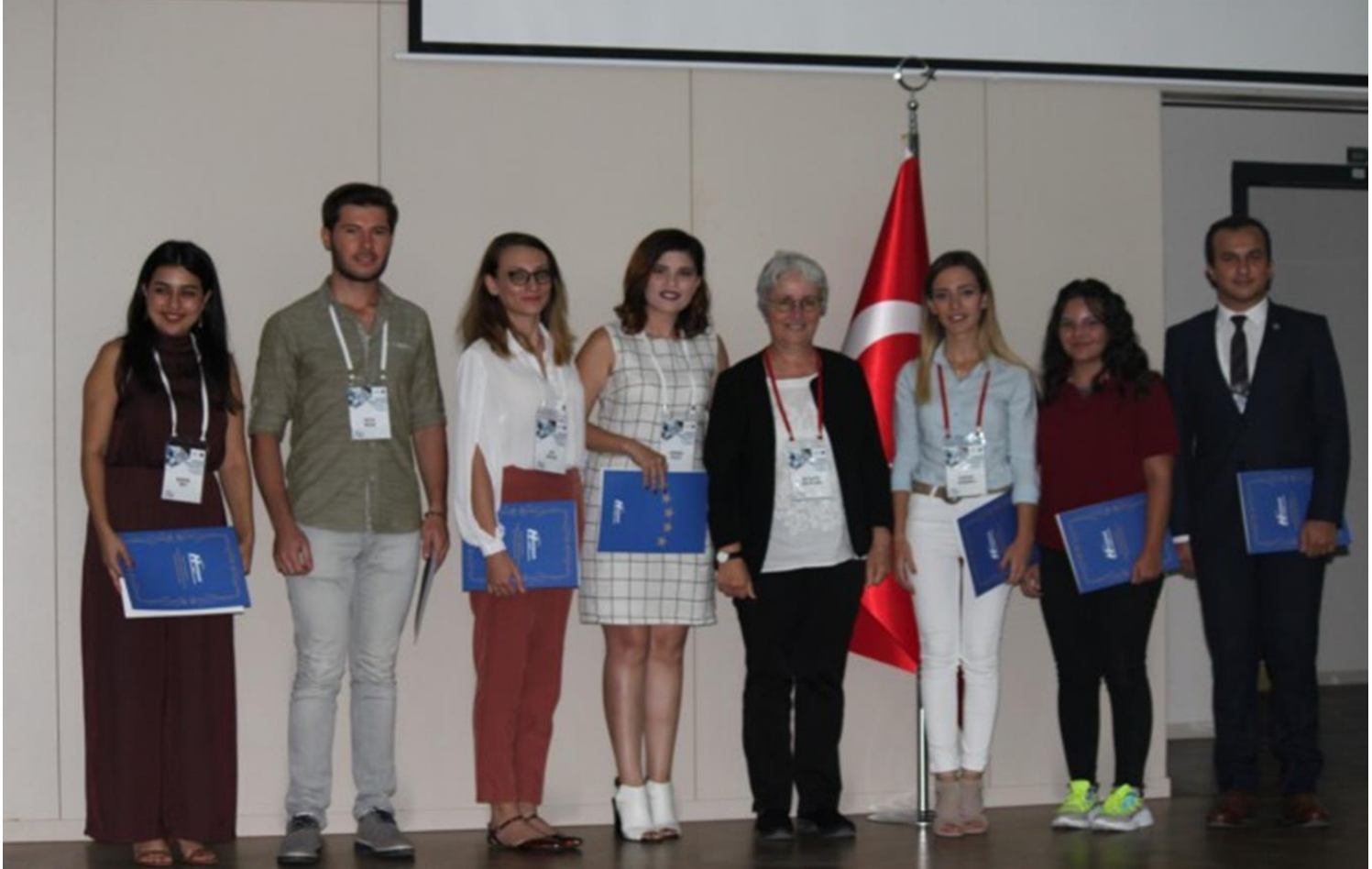
19.ULUSAL HEMŞİRELİK ÖĞRENCİLERİ KONGRESİ 3-4 HAZİRAN 2021Trakya Üniversitesi Sağlık Bilimleri Fakültesi